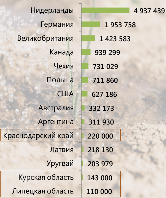
Источник: официальные статистические базы данных стран, данные BEFL (по курсу на 01.01.2020 г.)

Кроме того, в силу активного развития сельского хозяйства в России в последние годы заметно улучшение качества инфраструктуры, наблюдаются рост новых мощностей хранения и развитие портовых терминалов, постепенно идет выкуп земли из паевой собственности, что делает структуру прав на землю более понятной для покупателя.