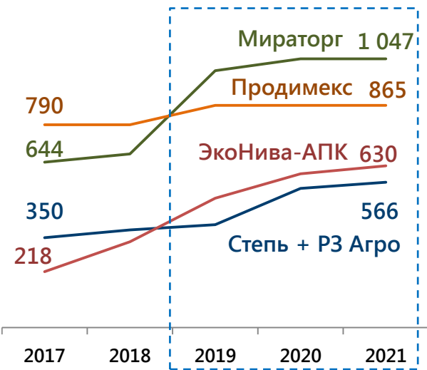
Лидеры по приросту земельного банка: динамика за пять лет, тыс. га